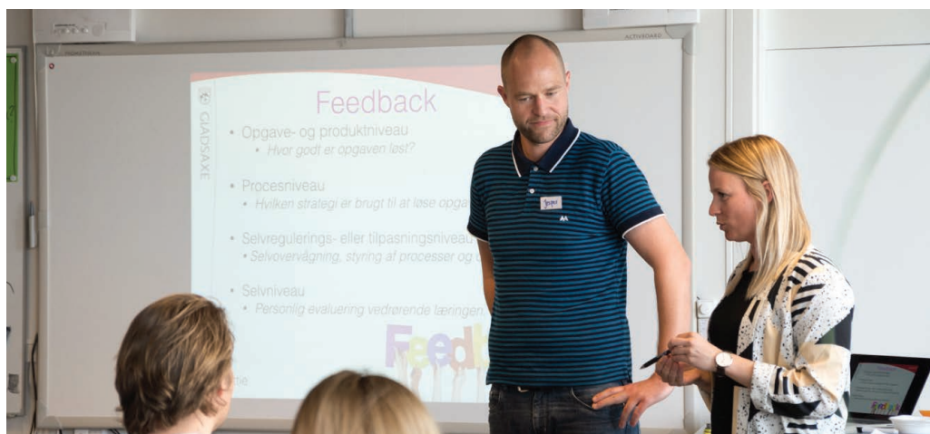
Fra uddannelsen i synlig læringsmål på GPV

Det er afgørende, at lærere og pædagoger har et højt fagligt niveau, og at lederne